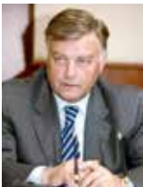
Владимир Якунин, президент ОАО «Российские железные дороги»

Глава компании «Российские железные дороги» в своём блоге дал ответ на многочисленные претензии в адрес холдинга, поступающие от пассажиров пригородных поездов.